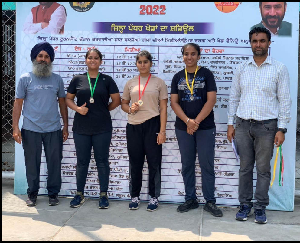
September 30- October 02, 2022