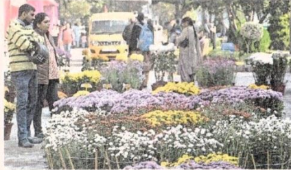
ਪੀਏਯੂ 'ਚ ਫਲਾਵਰ ਸ਼ੋਅ ਦੌਰਾਨ ਫੁੱਲਾਂ ਨੂੰ ਦੇਖਦੇ ਲੋਕ। (ਸੱਜੇ) ਫੁੱਲਾਂ ਦੀ ਖੂਬਸੂਰਤੀ ਨੂੰ ਸੋਧਾਈਲ ਕੇਮਰੇ 'ਚ ਕੈਦ ਕਰਦੀਆਂ ਮੁਟਿਆਰਾਂ।