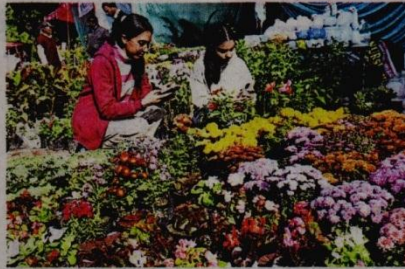
रुधियाना के पीएयू में आयोजित फलार शो के दौरान वीरवार को लोग प्रदर्शनी में लगे विभिन्न प्रजातियों के फूलों की छोटी खींचते हुए